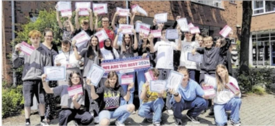
Die Klasse R7a freut sich über ihre erfolgreiche Teilnahme am Sprachwettbewerb Big Challenge.

Nicht nur die Muttersprachlerin zeigte sich vom